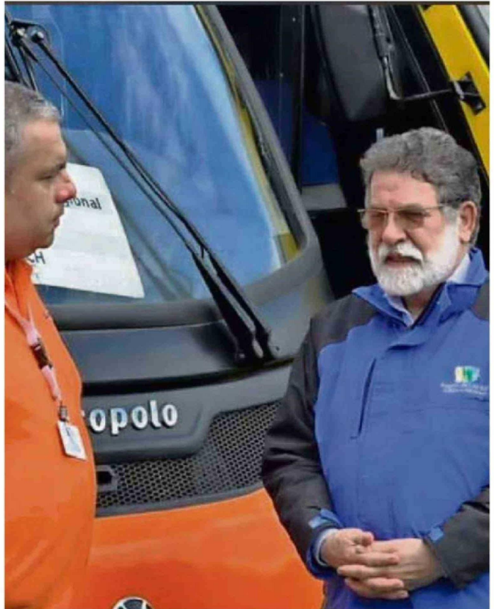
LA NUEVA CONVOCATORIA DEL PROGRAMA RENUEVA TU MICRO ESTÁ ABIERTA.

El uso de estos recursos, a nivel nacional, ha generado críticas desde el Congreso y Contraloría, debido a una eventual falta de transparencia y a que han sido destinadas a obras que no se relacionan con el transpor-