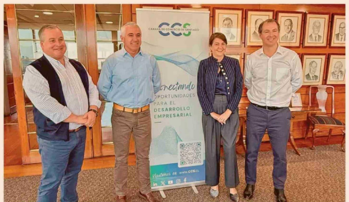
La integración con RedNegocios, también parte de la CCS, conecta los módulos de Abastecimiento Estratégico de Artikos con más de 8.000 proveedores evaluados y precalificados.