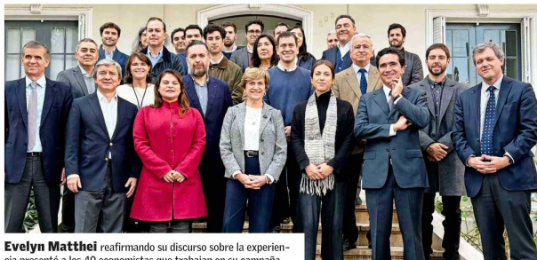
Evelyn Matthei reafirmando su discurso sobre la experiencia presentó a los 40 economistas que trabajan en su campaña.

El mismo día en que los comicios legislativos en Buenos Aires dieron un espaldarazo al Presidente Javier Milei, en Chile, Kast alcanzó a Matthei en la última Cadem y las estrategias se reordenan sobre una brecha más corta entre Chile Vamos y el Partido Republicano. Y a pesar de que desde los comandos desestiman que las elecciones en la capital argentina pudieran ser un escenario extrapolable a los comicios presidenciales y parlamentarios de noviembre, analistas reparan en que las nuevas derechas ganan terreno.