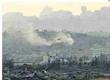
BOMBARDEO DEJÓ REDUCIDO A ESCOMBROS BARRIO RESIDENCIAL EN GAZA.