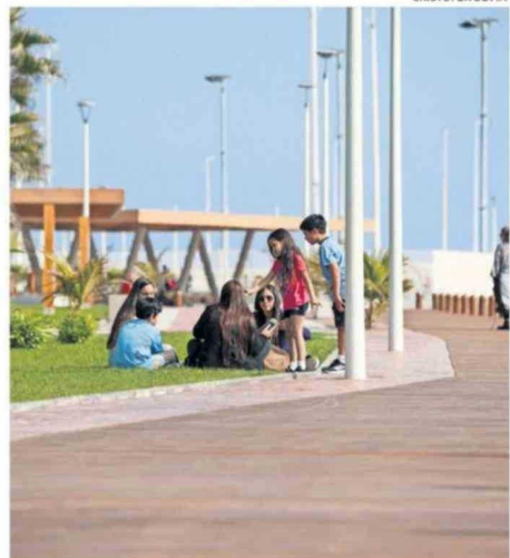
FAMILIAS DISFRUTANDO DEL RENOVADO BORDE COSTERO.