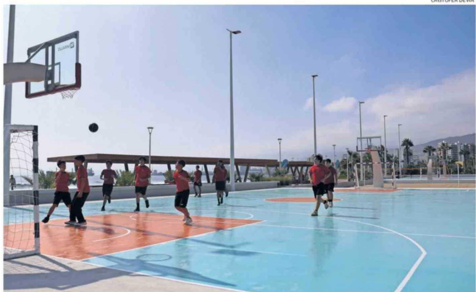
EL PROYECTO ADEMÁS SUMÓ MEJORAS NO CONTEMPLADAS ORIGINALMENTE, ESPECIALMENTE EN MATERIA DEPORTIVA.

La iniciativa, financiada por el Gobierno Regional con una inversión superior a los $5.400 millones, incorpora juegos infantiles, áreas verdes, iluminación, sombreaderos, accesibilidad universal y canchas completamente reacondicionadas.