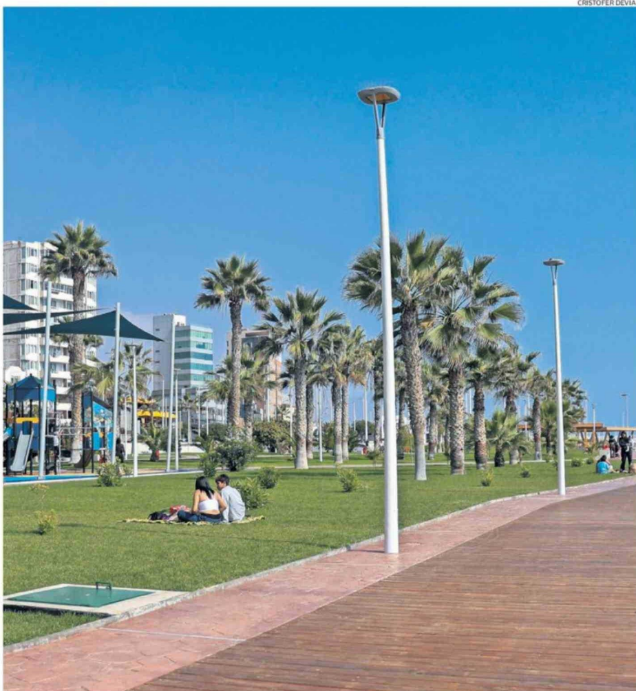
EL NUEVO ESPACIO CONTEMPLA ZONAS FAMILIARES, CIRCUITOS DE CALISTENIA Y CANCHAS PARA BABY FÚTBOL, BÁSQUETBOL Y VOLEIBOL PLAYA.