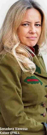
Senadora Vanessa Kaiser (PNL).

Previno, en todo caso, que el SD no debe aparecer diciendo "que no a todo, sin hacer propuestas concretas".