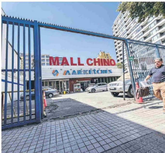
Marketches y Lida, del mismo dueño, son la cadena de malls chinos más grande del país en superficie de ventas. En la foto, su local de Pedro de Valdivia en Ñuñoa.

Tiraje: 78.224 Lectoría: 253.149 Favorabilidad: No Definida