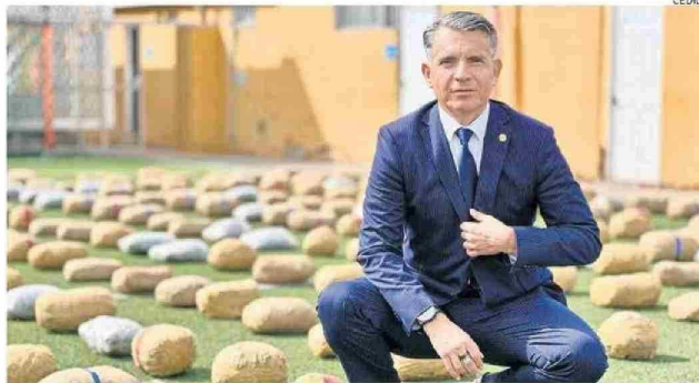
CASTRO BEKIOS ABORDÓ LOS RIESGOS QUE ABORDA LA REGIÓN EN MATERIA DE SEGURIDAD EN EL CORREDOR.