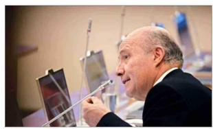
El ministro de Hacienda, Jorge Quiroz, ha advertido sobre una mayor presión fiscal para este año.

drá una mayor presión a las finanzas públicas" en un momento en que se espera una mayor emisión de deuda.