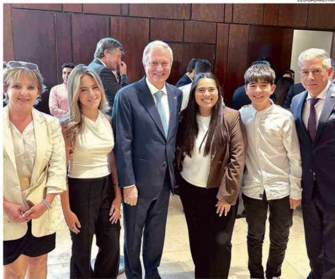
FUTURO DELEGADO, ACOMPAÑADO DE SU FAMILIA, PUDO REUNIRSE CON EL PRESIDENTE ELECTO.