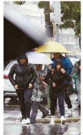
SE REGISTRARON INTENSAS LLUVIAS.