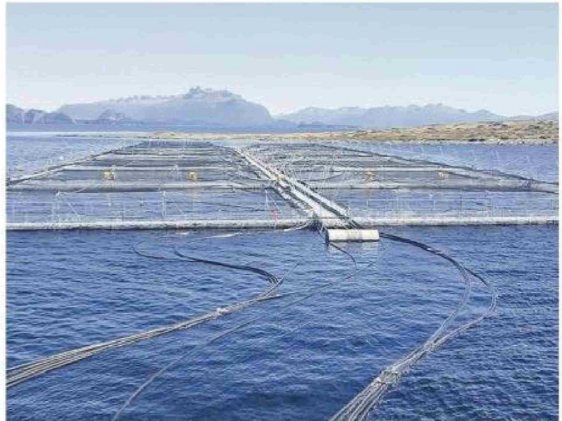
El AquaForum se realiza en un momento clave para la salmonicultura en Magallanes, en medio de debates por la expansión de concesiones, la relación con pescadores artesanales y el turismo, y las exigencias ambientales derivadas.

» La presencia del subsecretario Osvaldo Urrutia y del gobernador Jorge Flies en el evento anticipa posibles anuncios o lineamientos estratégicos para el sector