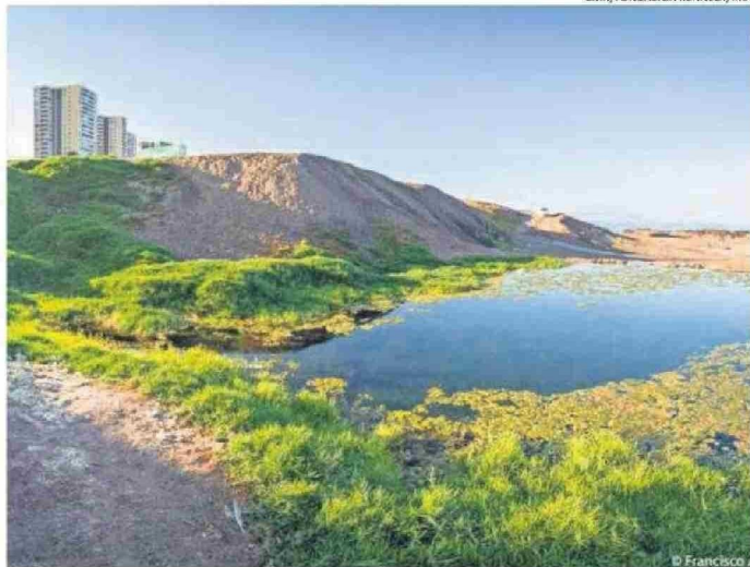
LA INICIATIVA BUSCA RESGUARDAR LOS HUMEDALES DE ANTOFAGASTA.

La elaboración del instrumento se realizó con un enfoque participativo, incorporando observacio-