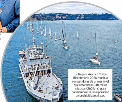
La Regata Aramco Chiloé Bicentenario 2026 reunió a competidores de primer nivel que recorrieron 140 millas náuticas (260 kms) para conmemorar la incorporación del archipiélago al país.