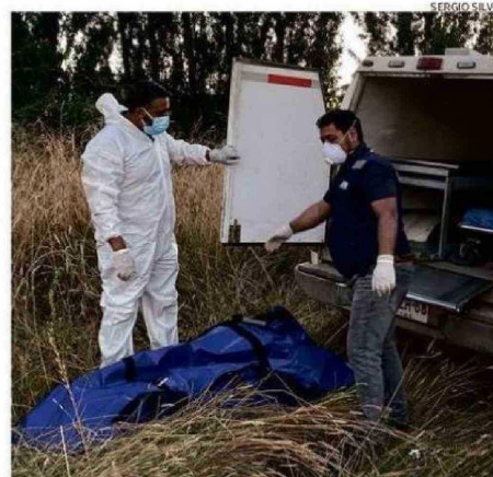
PERSONAL DE LA SIP DE CARABINEROS PERICIÓ EL CUERPO.