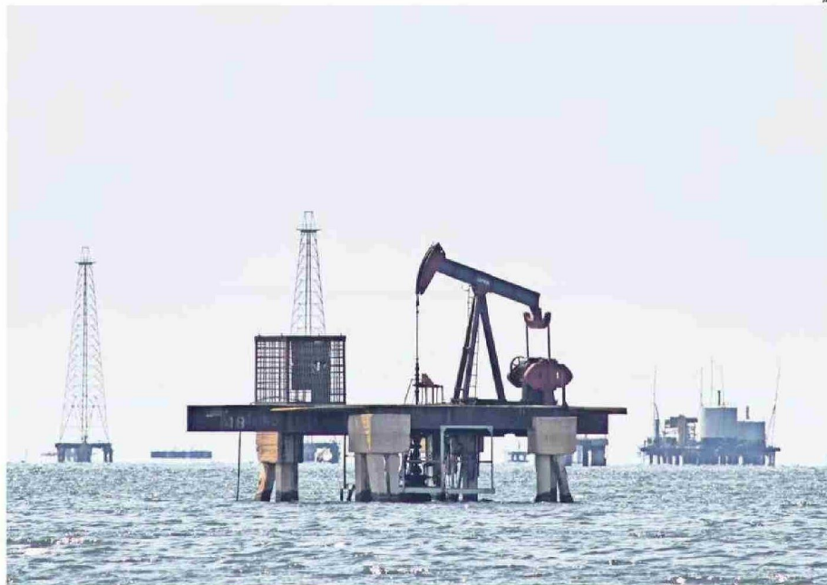
PLATAFORMA PETROLÍFERA ABANDONADA EN VENEZUELA. NO SÓLO ESTE RECURSO SERÍA EL QUE NECESITA ESTADOS UNIDOS.

Respecto de lo primero, mucha atención se ha puesto a las declaraciones del propio Presidente Trump acerca de que uno de los motivos de la acción sea el petróleo. Esta visión debe ser matizada. Es cierto que Venezuela cuenta con las mayores reservas de petróleo del planeta; pero son yacimientos con capital degradado y que requieren de inversiones que - según analistas del rubro - podrían demorar más de una década en incorporarse a la oferta mundial. Quizás más importante, y prácticamente eludido en los análisis sobre el tema, se encuentra el hecho de que Venezuela es también rico en minerales estratégicos. El país contiene depósitos de casiterita (dióxido de estaño), níquel, titanio, rodio, coltán y otros minerales raros que están emergiendo como insumos clave para industrias de alto valor y cadenas de suministro críticas a nivel global. Cuando se va al último reporte relativo a minerales críticos elaborado