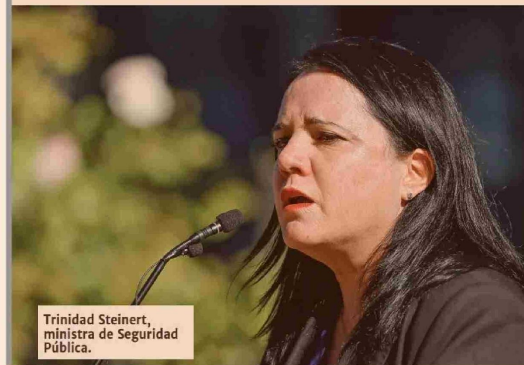
Trinidad Steinert, ministra de Seguridad Pública.

Esto, dijo la autoridad, se debe a la obligación de "responder a las necesidades urgentes de nuestras policías, garantizar su funcionamiento, fortalecer su capacidad operativa, y dar respuestas concretas a la ciudadanía". Asimismo, adelantó que además de no recortar el presupuesto de la cartera, comenzará un trabajo colaborativo con la Dirección de Presupuestos (Dipres) con el fin de que "ellos (PDI y Carabineros de Chile) tengan más herramientas, por ejemplo de protección, chalecos antibalas, medios tecnológicos también".