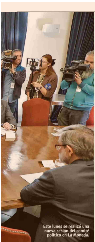
Este lunes se realizó una nueva sesión del comité político en La Moneda.