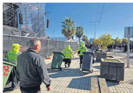
Equipos municipales se encargaron de la limpieza del parque.