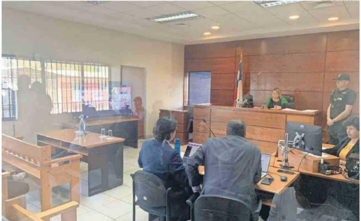
AYER Y SIN PRESENCIA DEL IMPUTADO EN EL JUZGADO DE GARANTÍA DE CALAMA SE FORMALIZÓ POR UN HOMICIDIO CONSUMADO Y OTROS CUATRO FRUSTRADOS AL ATACANTE DE 18 AÑOS

El persecutor informó además que “la planificación consistía en señalar una fecha límite, la cual sería el 15 de mayo; el lugar a ejecutar sería el Instituto Obispo Silva Lezaeta; y el motivo: ‘odio, capitalismo y misantropía’. Esto último definido como el rechazo y desprecio a la especie humana y al trato con otras personas. Respecto a la caracterización de la planeación, el texto señala un solo perpetrador, acción individual, sin cómplices ni incitadores, y un lugar escogido por accesibilidad y conocimiento de las instalaciones. El número estimado de víctimas se fijó entre una a cuatro, siendo el número “idílico ocho víctimas, buscando el mayor impacto a nivel nacional sin precedentes hasta la fecha. El imputado consignó no pretender sobrevivir y, en caso de hacerlo, perseguiría de forma activa la muerte en reclusión”, detalló el fiscal Eduardo Peña.