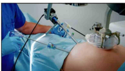
La tecnología será implementada en el Hospital San Camilo, convirtiéndose en el primer hospital público fuera de Santiago en