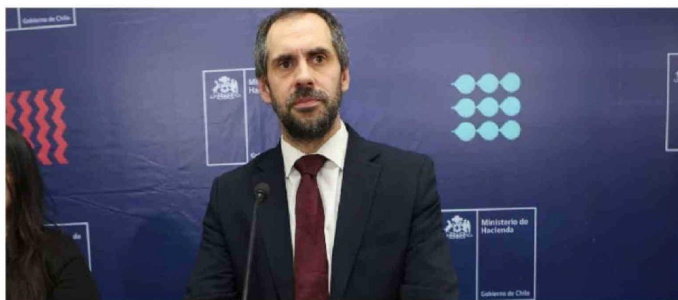
► Nicolás Grau, ministro de Hacienda.