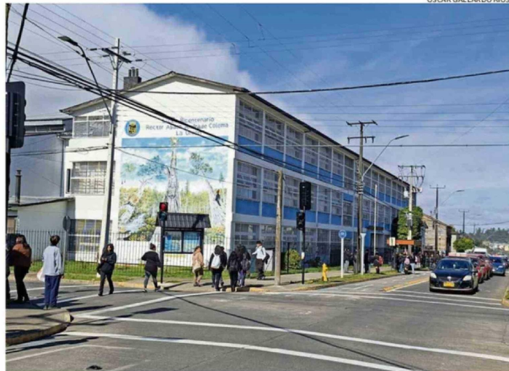
LOS ESTUDIANTES DEL LICEO ABDÓN ANDRADE FUERON ENVIADOS A SUS CASAS PASADAS LAS 11.30 HORAS.

El imputado fue puesto ayer a disposición del Juzgado de Garantía de Valdivia para el control de detención y formalización de la investigación. Durante la audiencia, compareció un representante del Liceo Comercial, quien informó que se estaba tramitando la expulsión del estudiante, y con aprobación del juez de Garantía se llegó a un acuerdo reparatorio que establece el pago de 79 mil pesos por parte del imputado,