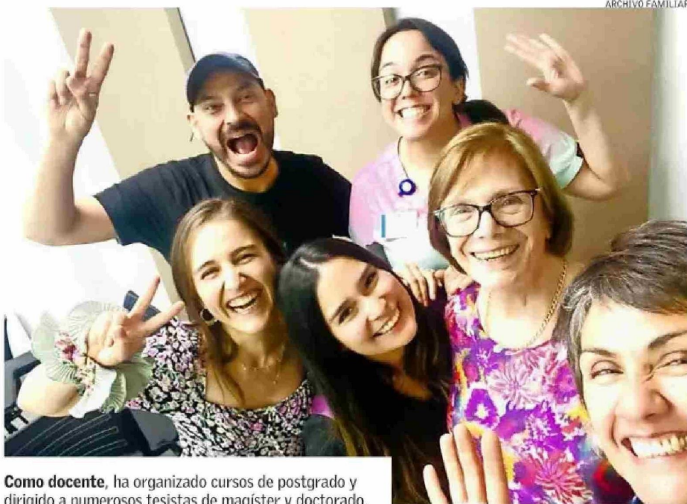
Como docente, ha organizado cursos de postgrado y dirigido a numerosos tesis de magister y doctorado.