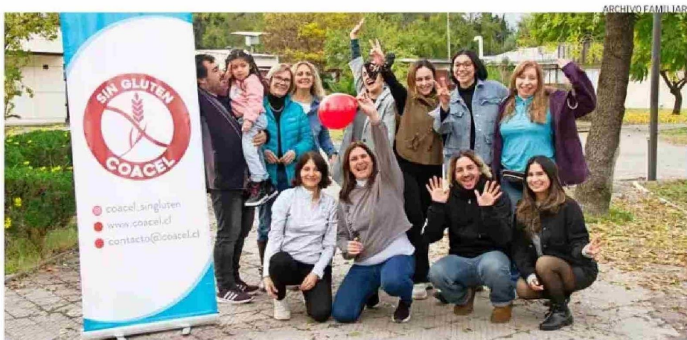
Junto al equipo de Coacel, que preside hace tres décadas. Entre sus tareas, apoyan a pacientes celíacos y asesoran a la industria que produce alimentos libres de gluten.

ción que, paradójicamente, se alimentaba de re-sabios de la desnutrición.