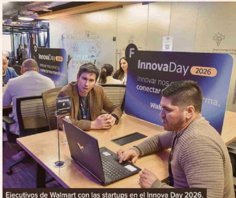
Ejecutivos de Walmart con las startups en el Innova Day 2026.