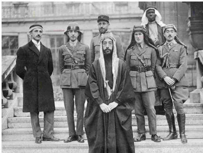
Lawrence de Arabia escribió el libro "Los siete pilares de la sabiduría".

De este lado del Atlántico, el libro de Lawrence impresionó fuertemente a Borges, que años