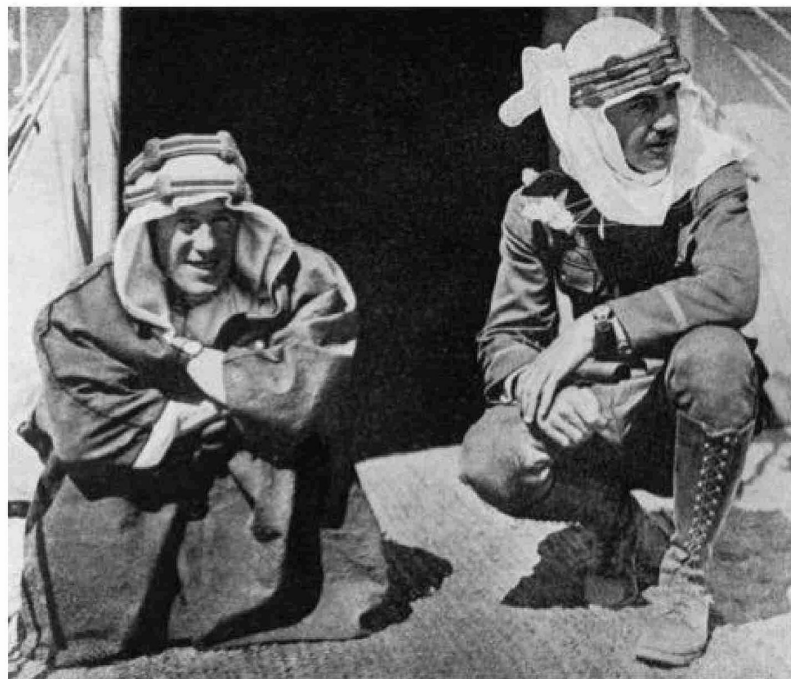
Controvertido y desconcertante, la figura de Lawrence de Arabia es resaltada por unos y censurada por otros. Su importancia histórica es indiscutible.

después opinó así sobre él en una conferencia: "Hemos vivido dos guerras mundiales, pero, por alguna razón, no ha surgido de ellas una épica; excepto, quizá, 'Los siete pilares de la sabiduría'. En 'Los siete pilares de la sabiduría' encuentro muchas cualidades épicas. Pero el libro está lastrado por el hecho de que el héroe es el narrador, por lo que a veces debe empequeñecerse, humanizarse, hacerse verosímil en exceso. De hecho, se ve obligado a incurrir en los trucos del novelista", dijo.