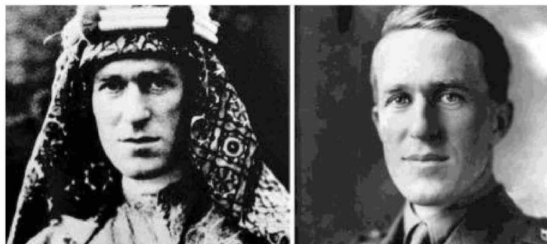
Lawrence de Arabia fue asesor para temas de Medio Oriente de Winston Churchill en 1921.