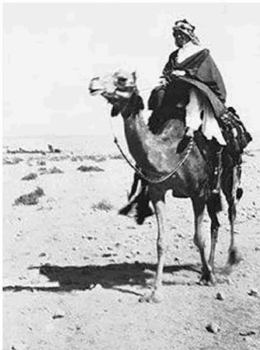
Lawrence de Arabia en un camello recorriendo los desiertos de Medio Oriente.