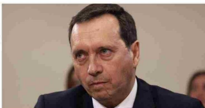
Director de la PDI defiende la remoción de exsubdirectora de Inteligencia y asegura que fue una decisión "institucional"