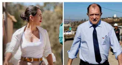
Reconstrucción en Viña del Mar: Ripamonti y Poduje acuerdan nuevo plan por macrosectores para destrabar obras en El Olivar