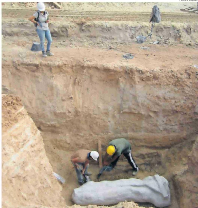
LA INVESTIGACIÓN USÓ ANTECEDENTES DE MONITOREOS A OBRAS EN COQUIMBO.