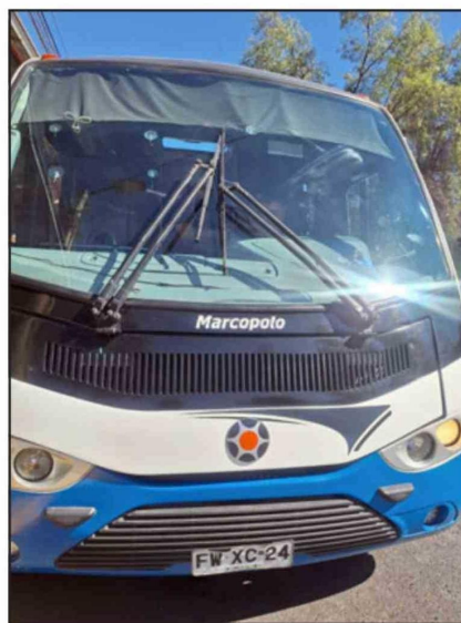
El conductor durante uno de sus recorridos, labor por la cual ha sido reconocido por su empatía y vocación de servicio.

«Cuando una persona se sube a una máquina, por lo menos para mí, es responsabilidad de uno (...) cada persona que sube, uno es responsable», afirmó, reflejando una visión profundamente humana de su labor.