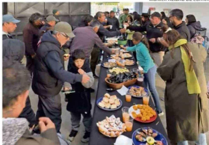
LA FIESTA SE HA TENIDO QUE REALIZAR BAJO TECHO POR LA LLUVIA.

Organizado por el Sindicato de Pescadores, la Cámara de Turismo de la Costa y la Municipalidad, el evento contempla seis días de actividades en la caleta, que iniciaron el 10 y terminan el 15 de febrero. La programación incluye música en vivo, gastronomía marina con el choro como producto estrella,