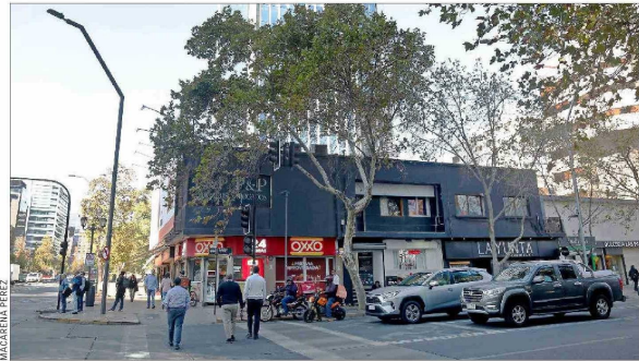
Esquina sur de Apoquindo con El Bosque.

Protopsaltis recalca que hoy el inmueble se encuentra completamente libre de restriccion-