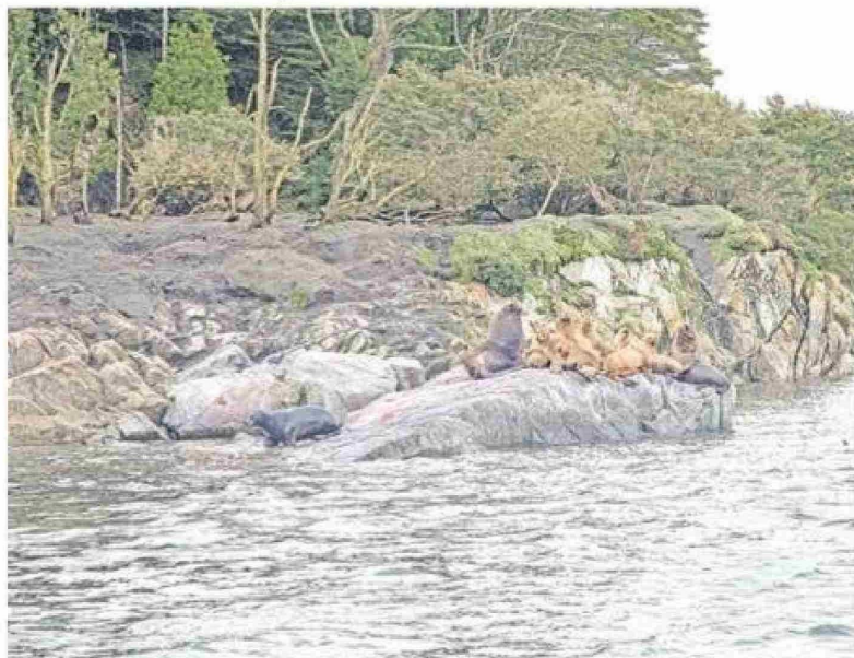
En esta zona se pueden ver delfines, colonias reproductivas de lobo marino común y pingüino magallánico, además de ballenas jorobadas, que viajan desde el hemisferio norte hasta las aguas interiores de Chile.