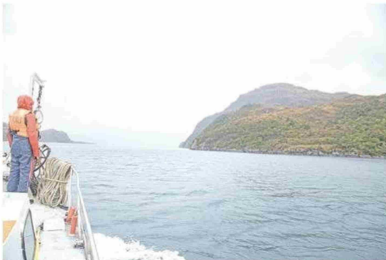
El parque incluye las cuencas costeras entre Laguna Blanca, Seno Otway, canal Jerónimo y Magallanes, y las subcuencas de las islas Santa Inés y Carlos III.