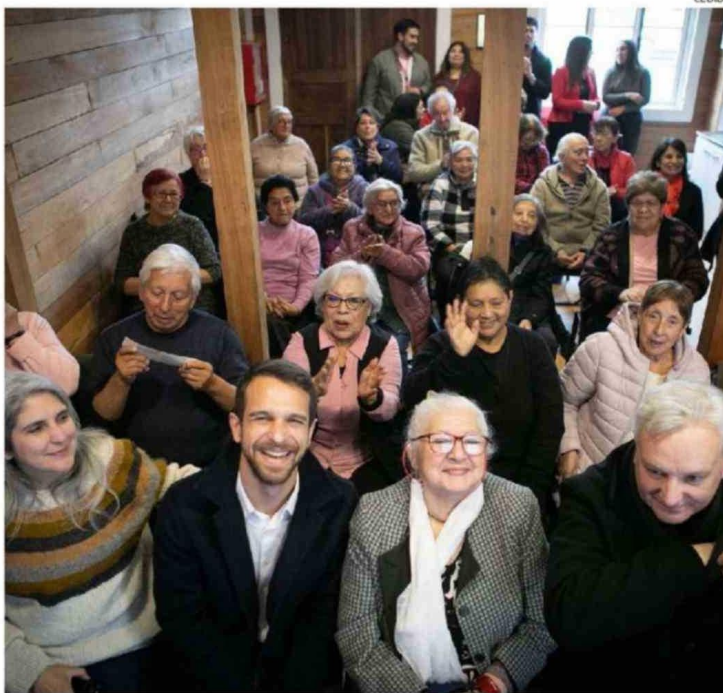
EL PLAN IMPULSADO EN PUERTO VARAS BENEFICIARÁ A 2.500 HOGARES DE LA COMUNA.

González además manifestó el rechazo de los municipios ante la amenaza de que el Go-