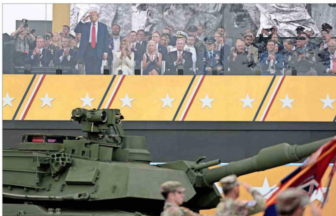
EN VARIAS OCASIONES, Trump se levantó y saludó mientras las tropas marchaban frente a la tribuna de revisión.

En las alturas, el equipo de paracaidistas Golden Knights del Ejército apareció en el cielo nublado, descendiendo hacia la tribuna de revisión. El salto del equipo se había programa-