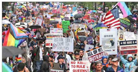
MANIFESTANTES del movimiento "No Kings" recorrieron Boston.

ron ciudades como Boston, Nueva York o Los Angeles, que esta semana vivió las mayores protestas contra la política mi-