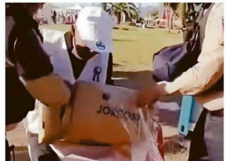
VENDEDOR AMBULANTE SIENDO DESPOJADO DE SUS PRODUCTOS

Según la autoridad policial, el día de la detención, el vendedor intentó evitar el decomiso force-