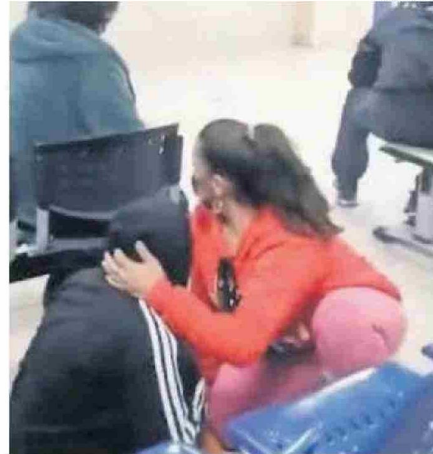
EL PÁNICO FUE TOTAL AL INTERIOR DEL RECINTO MÉDICO.

Ripoll, lamentaron los preocupantes hechos ocurridos y como dirección expresaron su rechazo "ante estos acontecimientos que vulneran las condiciones de seguridad y tranquilidad que debemos contar como recinto asistencial para atender a nuestra comunidad".