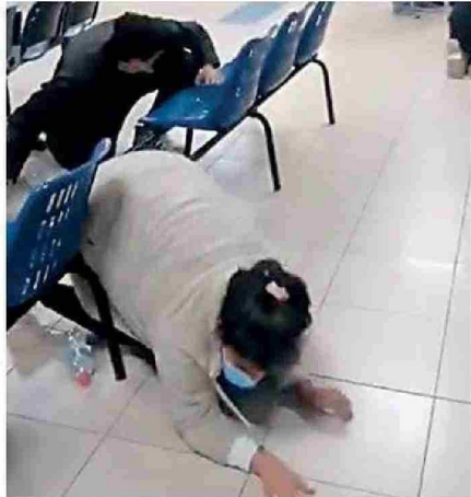
PACIENTES DEBIERON RESGUARDARSE ANTE LOS DISPAROS.