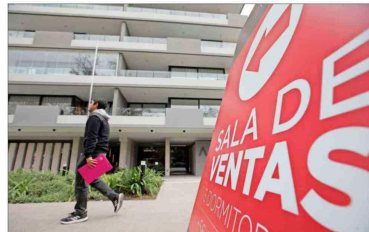
Según las cifras de Toctoc, la venta bruta de viviendas nuevas en el primer trimestre de 2026 en la RM llegó a 7.350 unidades, un alza de 9,4% anual.

En las cotizaciones de propiedades, el grupo etario más relevante son los millennials , mientras que por género lideran las mujeres, aunque luego tienen más dificultades para acceder a financiamiento.