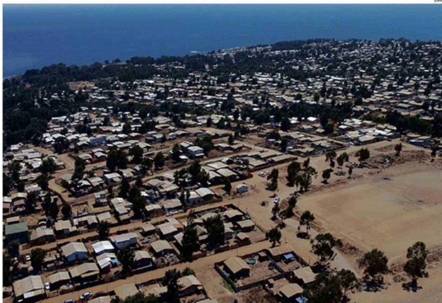
POBLADORES ACUSAN QUE EL GOBIERNO REALIZÓ PROMESAS QUE NO CUMPLIÓ.

Según la dirigente, "se prometieron muchas cosas, subsidios de urbanización, que seríamos propietarios, que íbamos a comprar y terminó con un desalojo con auxilio de la