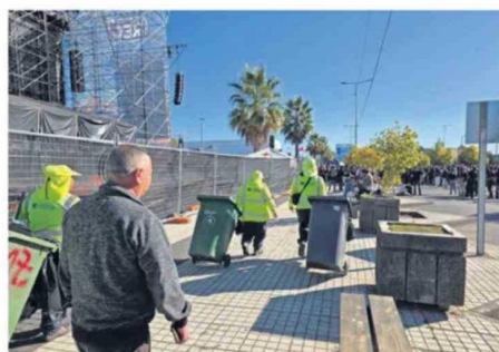
Equipos municipales se encargaron de la limpieza del parque.