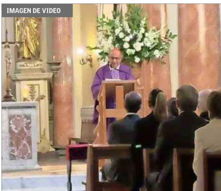
"La sangre de Jaime Guzmán hace una semilla de esperanza", aseguró el cardenal Chomali en su homilía de ayer.