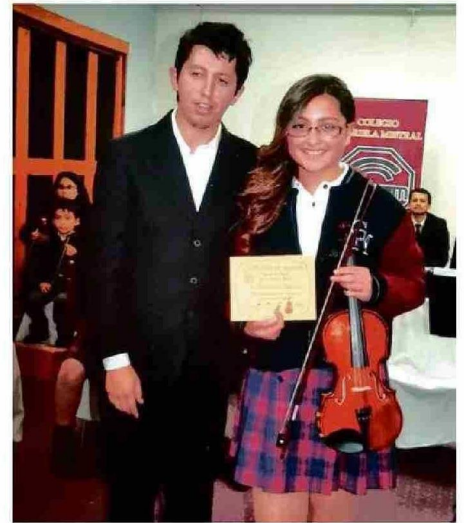
EN LA ÉPOCA DE LAS CLASES DE VIOLÍN, EN EL GABRIELA MISTRAL.

del liceo Gabriela Mistral y los momentos familiares que marcaron su infancia.