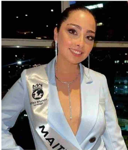
DURANTE SU PRESENTACIÓN EN EL CERTAMEN.