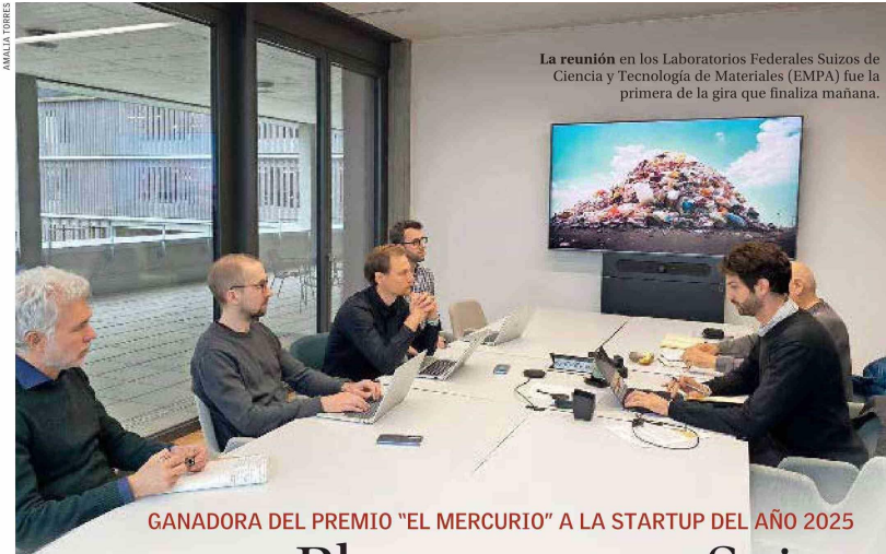
La reunión en los Laboratorios Federales Suizos de Ciencia y Tecnología de Materiales (EMPA) fue la primera de la gira que finaliza mañana.

GANADORA DEL PREMIO "EL MERCURIO" A LA STARTUP DEL AÑO 2025