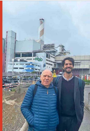
Al fondo, la planta de residuos de Hinwil, que procesa parte los desechos del cantón de Zúrich y recupera metales.

InnoWay recicla 50 mil toneladas de plásticos al año. Se trata de productos desechables procedentes de hogares, comercios e industrias.