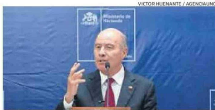
QUIROZ SUMÓ MEDIDAS A LAS ANUNCIADAS POR KAST.