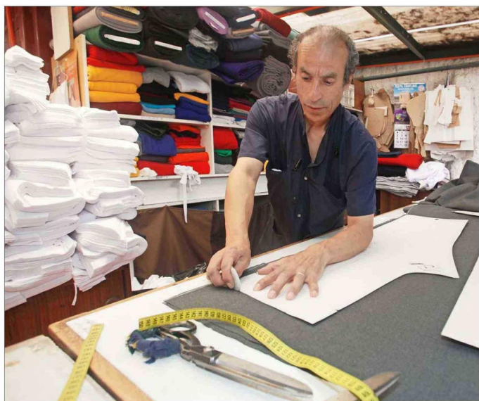
El deterioro del mercado laboral ha golpeado, especialmente, a las micro y pequeñas empresas que tienen hasta 49 trabajadores.

• Especialistas calculan que al trimestre septiembre-noviembre de 2025 en estas firmas de menor tamaño se destruyeron 74.984 puestos de trabajos asalariados formales.