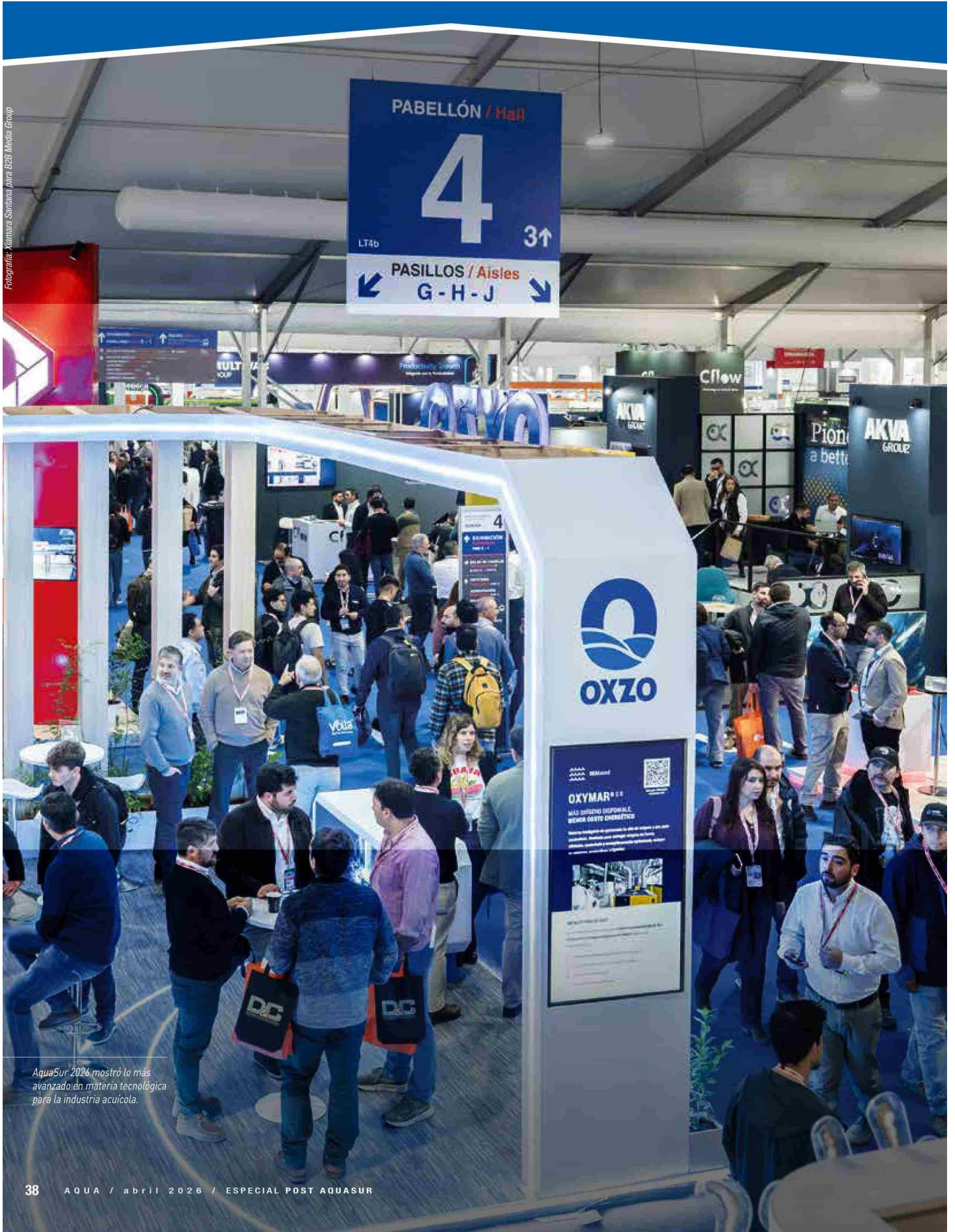
AquaSur 2026 mostró lo más avanzado en materia tecnológica para la industria acuícola.