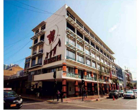
ESTE MIÉRCOLES SE CONOCERÍAN NUEVOS SEREMIS.