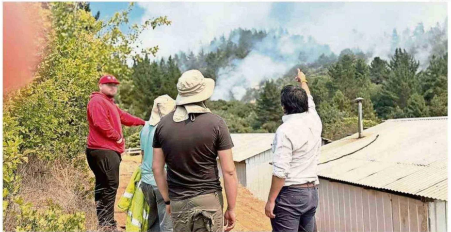
AUTORIDADES LOCALES HAN VISITADO A LOS VECINOS AFECTADOS. URGE LLEGAR CON AYUDA PARA LOS DAMNIFICADOS.