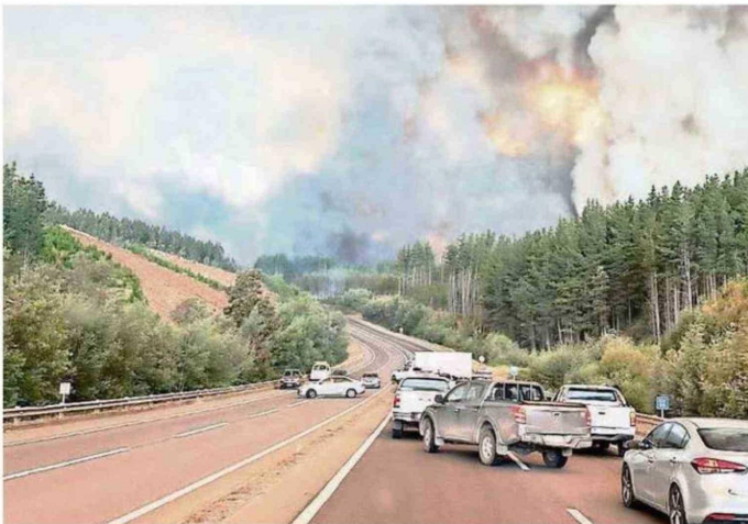
LAS RUTAS HAN ESTADO CON EL TRÁNSITO INTERRUPTIDO. LOS PAJES LATERALES SE ABRIERON SIN PAGO.