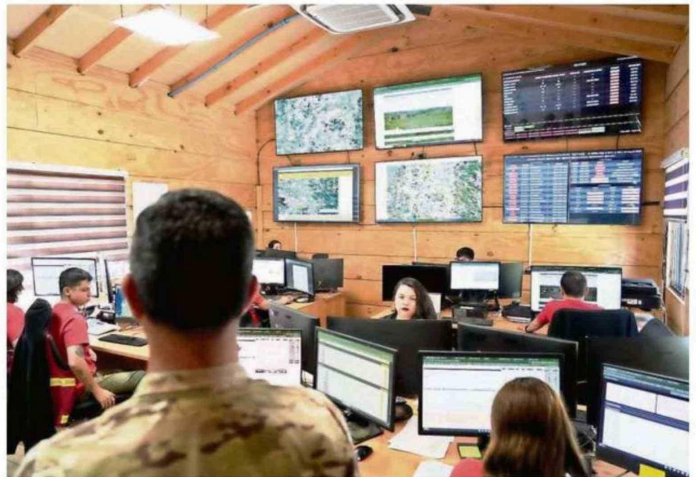
UNA DE LOS PUESTOS DE MANDOS DESDE DONDE SE MONITORIA LA SITUACIÓN.