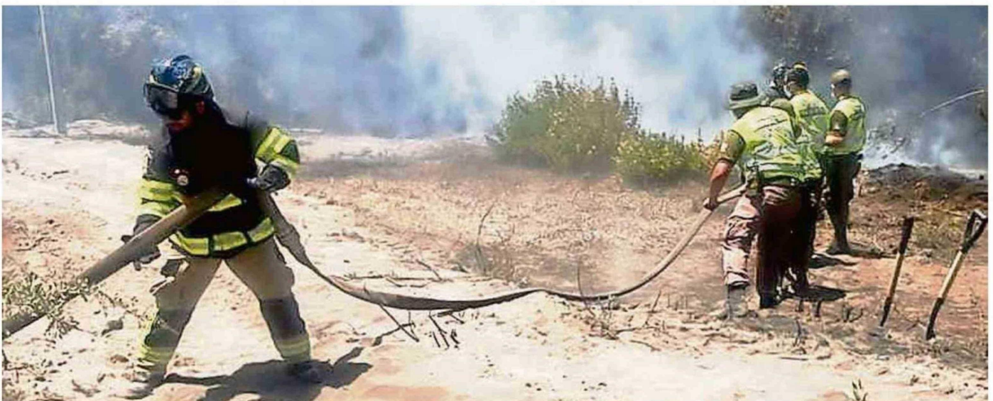
CARABINEROS, BRIGADIERAS Y BOMBEROS HAN SIDO LA PRIMERA AYUDA ANTE ESTA NUEVA EMERGENCIA QUE SACUDE LA REGIÓN.