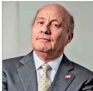
Jorge Quiroz , futuro ministro de Hacienda.

Tras las críticas del jefe económico del gobierno entrante por la desviación fiscal constatada en 2025, la autoridad remarcó el control de la inflación y la estabilización macroeconómica, descartando una “crisis”.