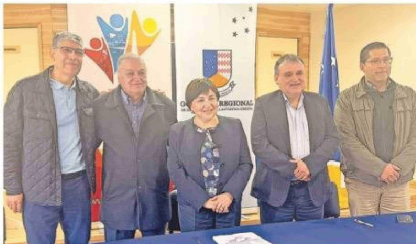
La protocolización de entrega del nuevo, amplio y moderno gimnasio Padre Mario Zavattaro.

lizado, hay una parte que la va a comprar el municipio, mediante llamado a licitación, dijo el edil. Pero en una segunda etapa esperan recibir aportes del Gobierno Regional, para terminar de dejar al día lo necesario para que el amplio coliseo deportivo pueda finalmente entrar en funciones.