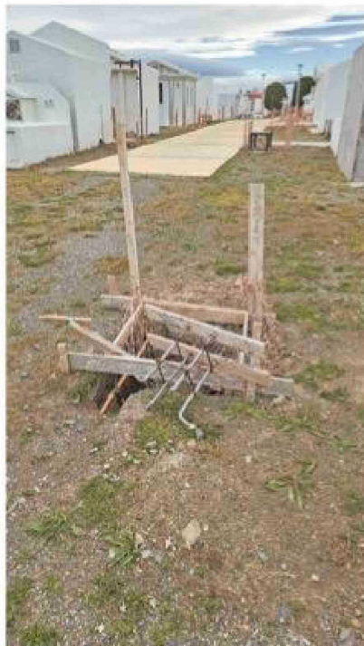
Con alguna empresa local que se interese, que será contratada en trato directo para terminar las obras, se podrá concluir el proyecto de construcción de senderos y mejoramiento eléctrico del cementerio de Porvenir.

La propuesta, si no se encuentra ningún detalle, es inaugurar el flamante gimnasio