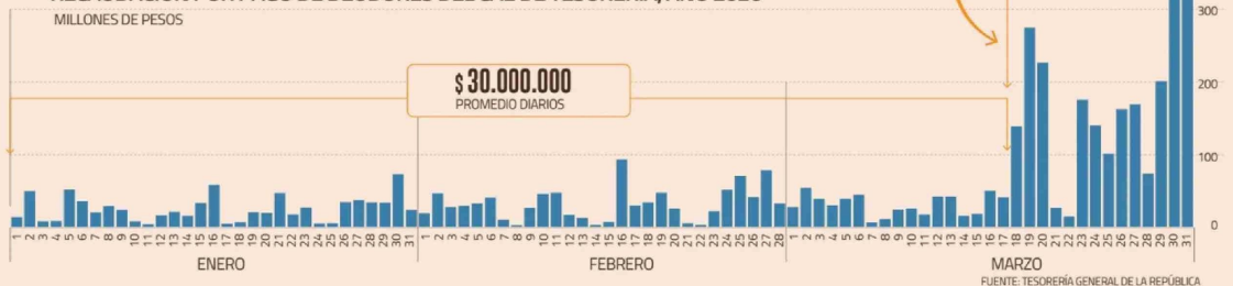
RECAUDACIÓN POR PAGO DE DEUDORES DEL CAE DE TESORERÍA, AÑO 2026

Esto nace de un planteamiento del excandidato presidencial del Partido de la Gente, Franco Parisi, quien puso sobre la mesa la idea de restituir el Fondo de Utilidades Tributarias (FUT) que existió hasta 2016 y que consideraba las utilidades