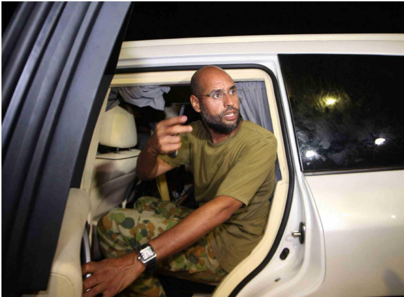
► Cuatro años después de salir de la cárcel, en 2021 Saif al-Islam anunció que se presentaría a las elecciones presidenciales.

Título: La misteriosa muerte del hijo de Gaddafi que alguna vez fue visto como el próximo líder de Libia